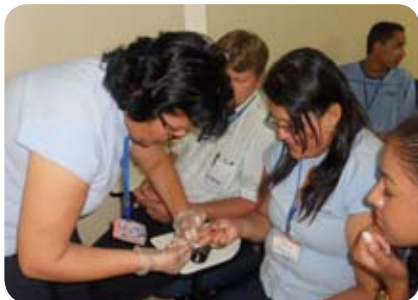
Exames de glicemia capilar e decoração azul para o combate ao diabetes