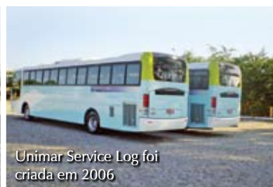
Unimar Service Log foi criada em 2006