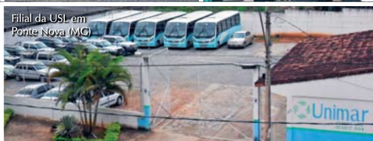
Filial da USL em Ponte Nova (MG)